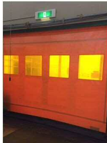
⑥内側は高速シャッター