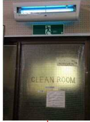
⑦壁掛け捕虫器(西側)