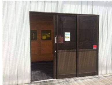
⑥金型、製品搬出入口